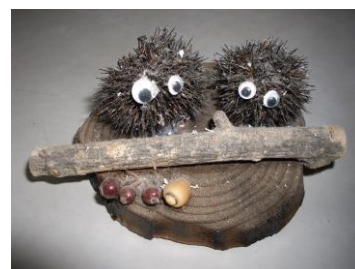
炭(栗のイガ)と焼き板によるクラフト