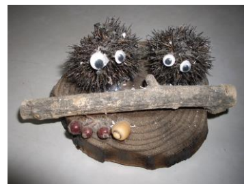
炭(栗のイガ)と焼き板によるクラフト