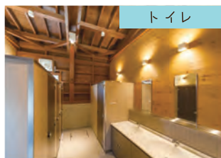
清潔で快適なトイレです♪

市民キャンプ場は利用期間中であればどなたでもご利用いただける施設です。ご家族やグループで泉ヶ岳の大自然の中でのアウトドアライフを満喫してください。