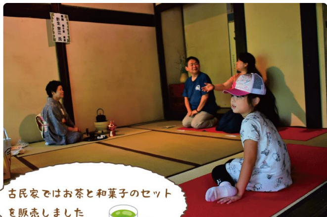
古民家ではお茶と和菓子のセットを販売しました